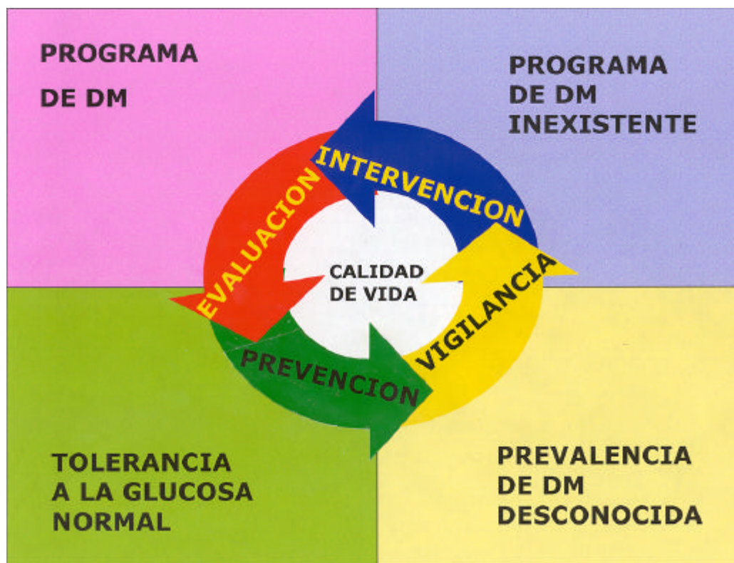
Figura 1. Modelo para el control de la diabetes en América Latina y el Caribe

programas nacionales de atención a personas con diabetes.