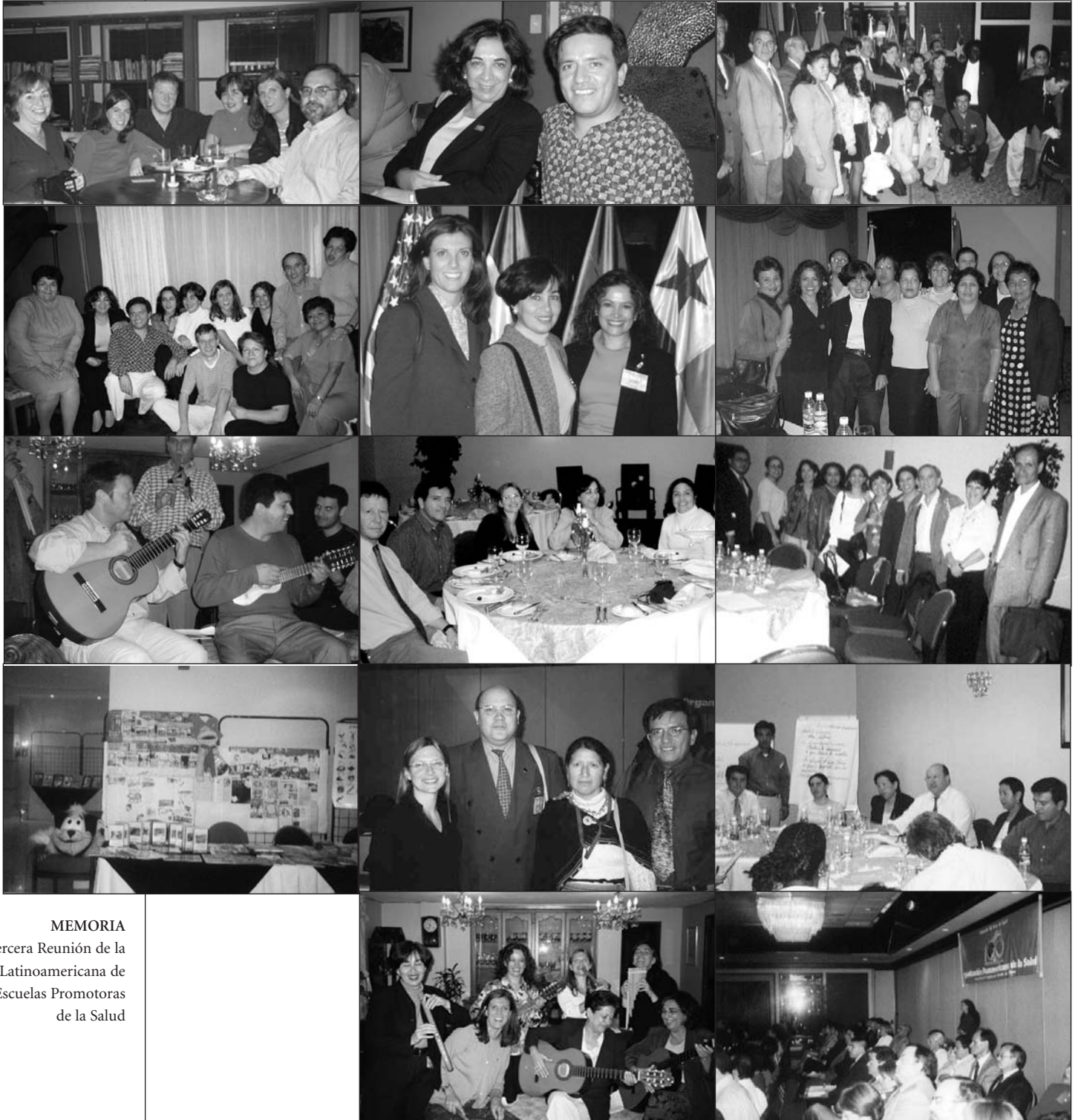
MEMORIA Tercera Reunión de la Red Latinoamericana de Escuelas Promotoras de la Salud