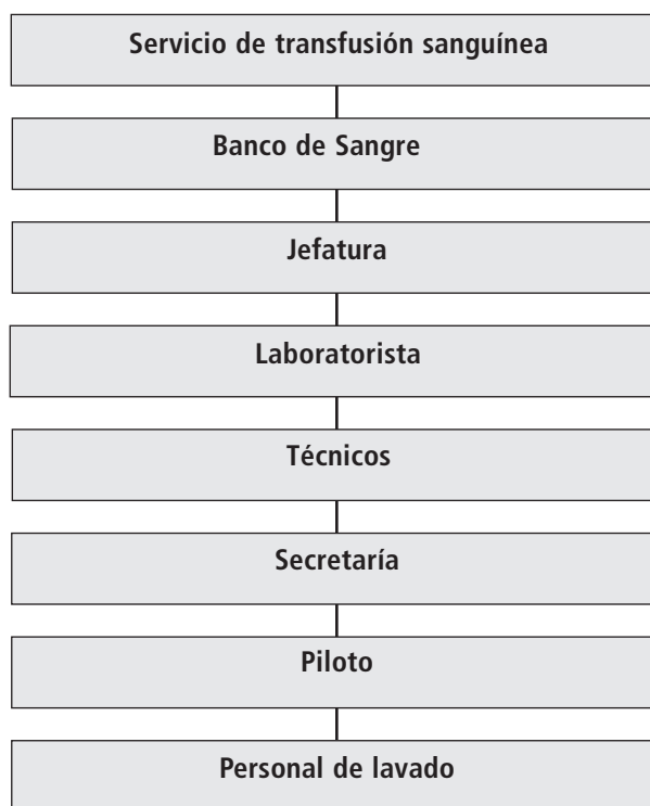
Cuadro 23: Ejemplo de un organigrama

También se pueden utilizar diagramas de flujo para describir y contrastar el flujo de eventos; curvas de crecimiento para mostrar el aumento o disminución en el tiempo de variables importantes; redes causales para describir relaciones dentro de relaciones independientes; taxonomías o etnoclasificaciones para clasificar los datos de acuerdo a temas culturalmente pertinentes, presentándolos en forma de clasificaciones o jerarquías; mapas cognitivos para ilustrar percepciones, creencias, conocimientos y explicaciones sobre lo que se está estudiando; dominio para organizar la información en categorías empleadas por los informantes; citas para ilustrar los temas importantes o las opiniones más frecuentes; etc.