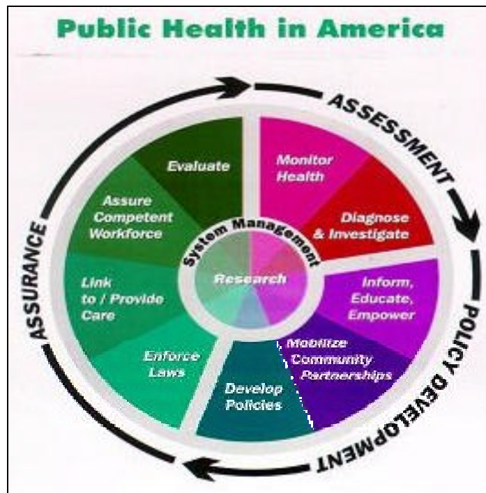
FIGURA 4. RUEDA DE SALUD PÚBLICA

La declaración estipula además que estas responsabilidades se llevan a cabo al prestar los servicios esenciales de salud pública, o sea, las actividades genéricas de la salud pública. Al igual que las funciones esenciales se describen como condiciones que permiten a los programas de salud pública funcionar mejor, los servicios esenciales se han concebido para combinarse de diversas maneras en la gestión y la ejecución de cualquier programa, bien sea la protección del agua potable o el control de la tuberculosis. Para ilustrar cómo los servicios esenciales identificados amplían la explicación sobre las funciones básicas y se administran en conjunto como parte del sistema de salud pública, a menudo se utiliza el gráfico de la rueda (véase figura 4).