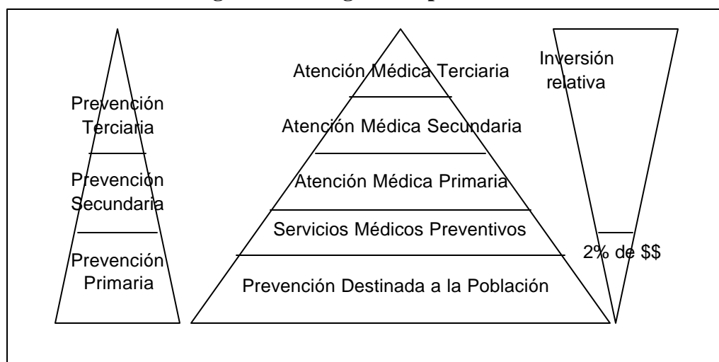
Figura 1. Triángulos de prevención

La pirámide de la derecha ilustra cómo, a nivel mundial, la inversión se hace al revés, ya que la mayoría de los recursos se destinan a las intervenciones después de que las enfermedades han ocurrido y no a los programas que podrían prevenirlas. Aunque la información al alcance dificulta la especificación exacta del nivel del gasto, el cálculo aproximado que se obtuvo (basado en estudios realizados en los Estados Unidos) es revelador. Se ha utilizado un modelo piramidal equivalente para describir el sistema de salud en Guyana. 4 Éste muestra en la base los puestos de salud y asciende por los centros de salud, los hospitales de distrito y los hospitales regionales, hasta llegar al hospital de referencia nacional.