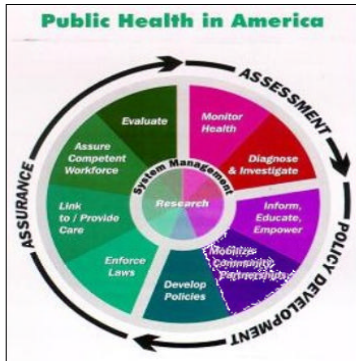
Figura 4. Rueda de salud pública

[de izquierda a derecha –primera sección de la rueda] Aseguramiento – Evaluación – Formulación de políticas