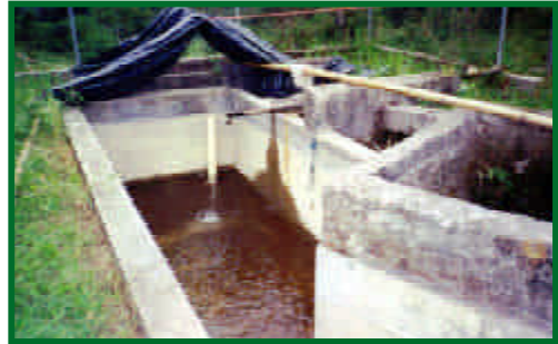
Estructuras y tanques de flocculación en el sitio Cascabel, cantón Lumbaqui, provincia de Sucumbios.