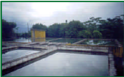
Canaletas y unidades de filtración en la población de Lumbaqui, cantón Lumbaqui, provincia de Sucumbios.