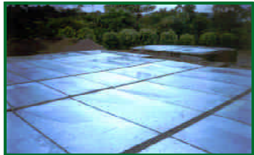
Vista general de las cubiertas metálicas colocadas en todas las unidades de la planta de tratamiento de la población de Lumbaqui, cantón Lumbaqui.

El sistema de alcantarillado aparentemente no sufrió ningún daño, a pesar de las lluvias que cayeron durante la erupción del Reventador, lo que ocasionó el arrastre de las cenizas hasta las tuberías del alcantarillado, sin que se produjeran taponamientos.