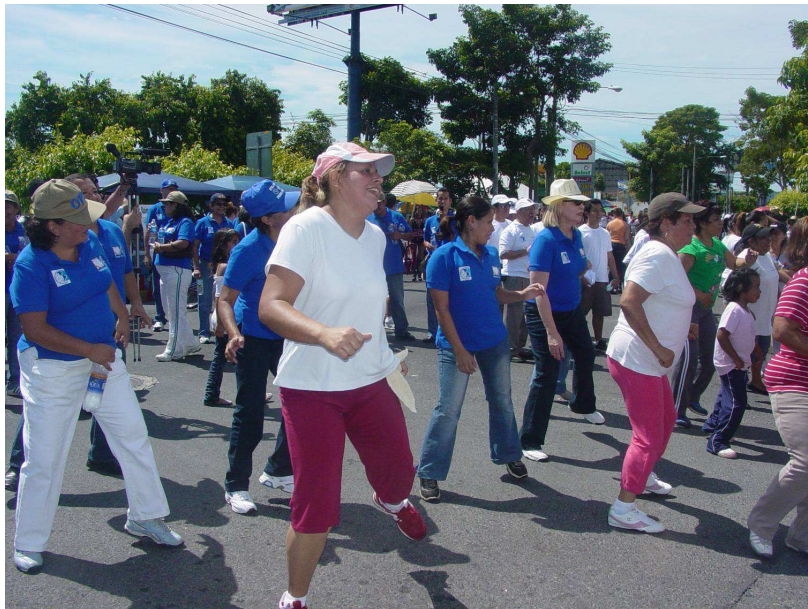
Al final de la Caminata hubo clases de aeróbicos en el marco de la Feria de la Salud Cardiovascular.