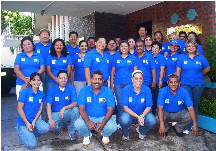
Parte del personal de la OPS/OMS El Salvador, listo para comenzar a caminar.

El Día Mundial del Corazón se celebró el pasado domingo 27 de septiembre con una caminata denominada “Corazones Sanos” . La Asociación Salvadoreña de Cardiología, el Ministerio de Salud Pública y Asistencia Social, el Ministerio de Educación, el Instituto Salvadoreño del Seguro Social, la Alcaldía de San Salvador y la OPS/OMS El Salvador se unieron para auspiciar la caminata, en la que participaron también institutos educativos, laboratorios farmacéuticos y el Colegio Médico.