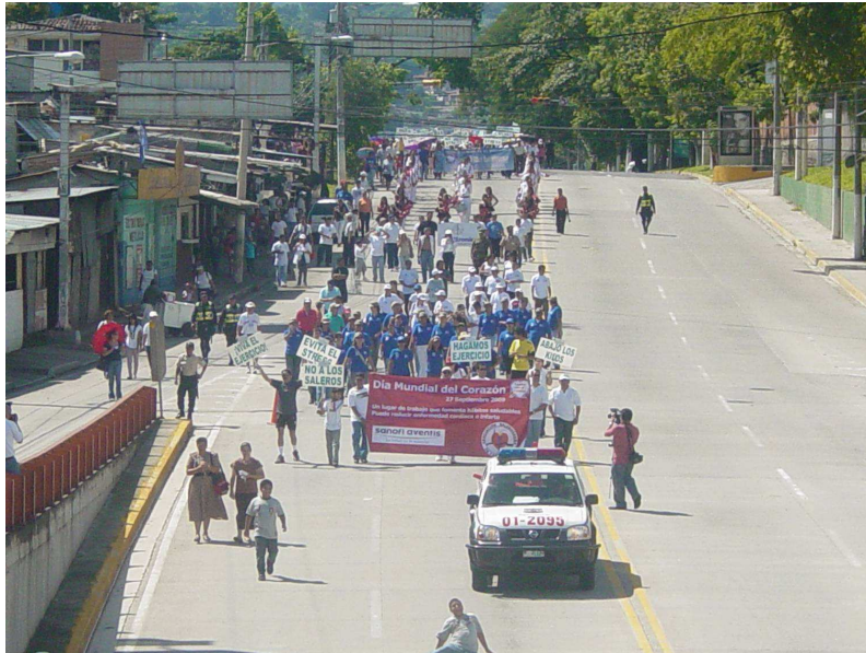
Imagen de la Caminata “Corazones Sanos”