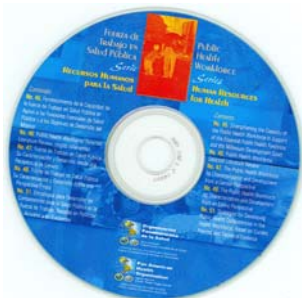
Fuerza de trabajo en Salud Pública: Serie Recursos Humanos para la Salud.