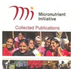
Micronutrient initiative, collected publicacions