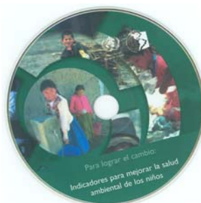
Indicadores para mejorar la salud ambiental de los niños. 2006