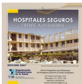
Hospitales seguros frente a desastres. Edición 2007