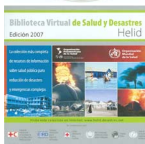
Biblioteca Virtual de Salud y Desastres. Edición 2007