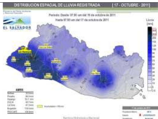
Lluvia acumulada en 24 horas correspondiente desde las 7:00 am del 16 al 17 de octubre a las 7:00 am