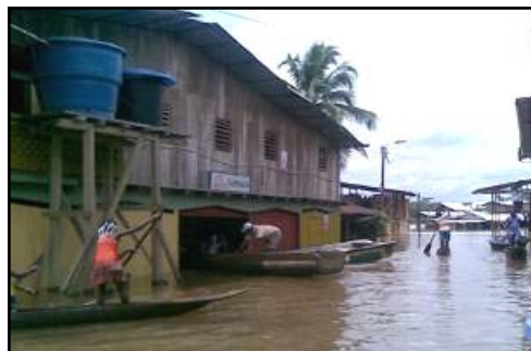
Inundación San Juan- Chocó