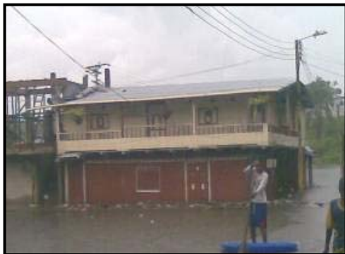
Inundación en Medio Baudó- Choco