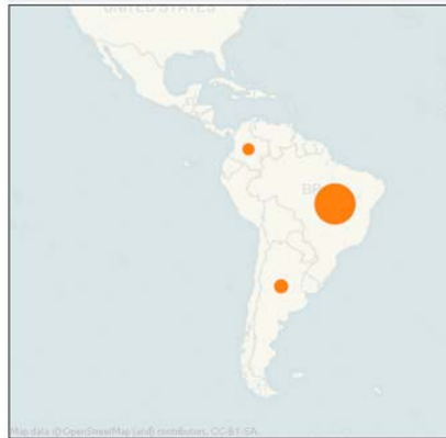
Mapa de indicadores por país, 2007