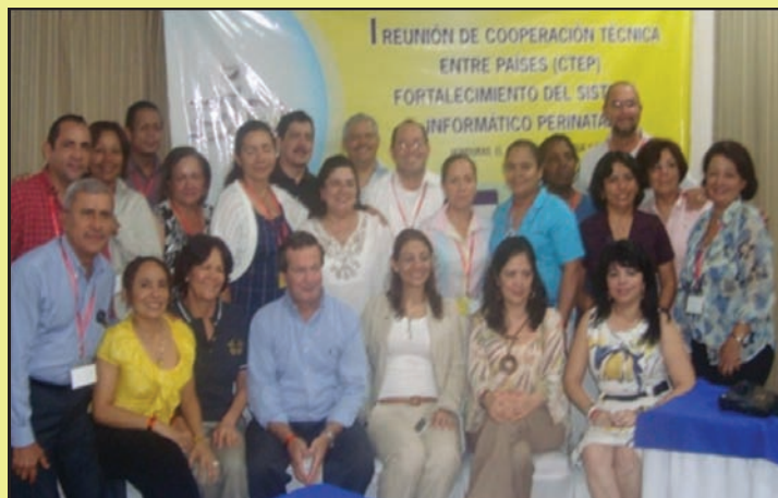
Participantes en la Reunión de Cooperación Técnica entre países para el fortalecimiento del SIP. Tela, Atlántida Honduras

El presente boletín presenta información sobre este importante proceso y muestra los avances en la institucionalización del SIP a la fecha. La Secretaría de Salud tiene disponible el documento de lineamientos para la implementación del Sistema Informático Perinatal integrado al proceso del Reordenamiento de la Gestión Hospitalaria que dirige el Departamento de Hospitales permitiendo con esto contribuir al monitoreo y evaluación de RAMNI en hospitales.