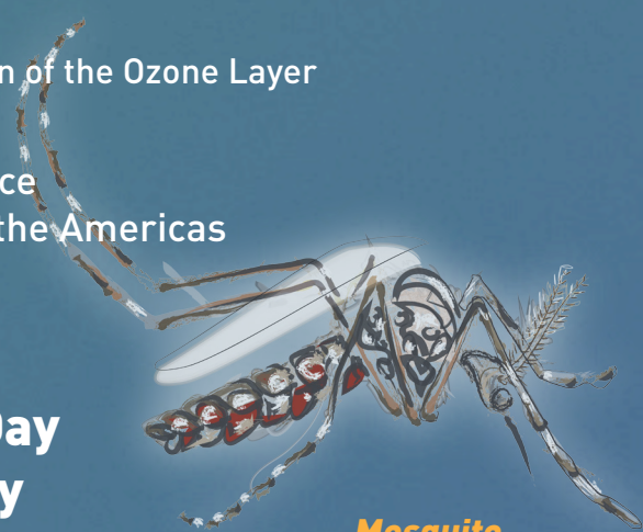
Mosquito Awareness Week