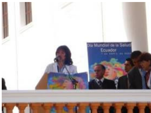
Dra. Caroline Chang, Ministra de Salud Pública del Ecuador

Finalmente, hizo la entrega formal de 32 nuevas ambulancias, destinadas a las necesidades de las provincias del Carchí, Imbabura, Pichincha, Cotopaxi y Loja, que se suman 115 ambulancias que ya han sido entregadas a las provincias de la Costa. "Por esa salud gratuita, de excelente calidad y calidez, para todas y para todos, por esta Patria tierra sagrada, terminó manifestando en su intervención el señor Presidente Constitucional de la República del Ecuador.