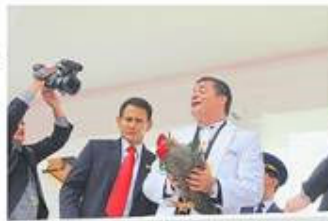
HEHE Y LERO | EXPRESO

El Primer Mandatario, ataviado de un mandil blanco, manifestó ayer en el hospital Eugenio Espejo que la conmemoración está dirigida a analizar y generar estrategias para combatir los efectos negativos del cambio climático.