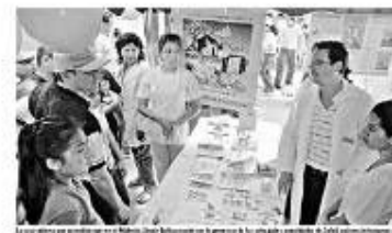
La secretaria de Salud en un momento de la presentación de la campaña de vacunación contra la gripe A en un centro de salud de la ciudad de Quito.

Reto Mundial de la Salud de evitar la gripe A en los países en desarrollo y en los países de ingresos bajos