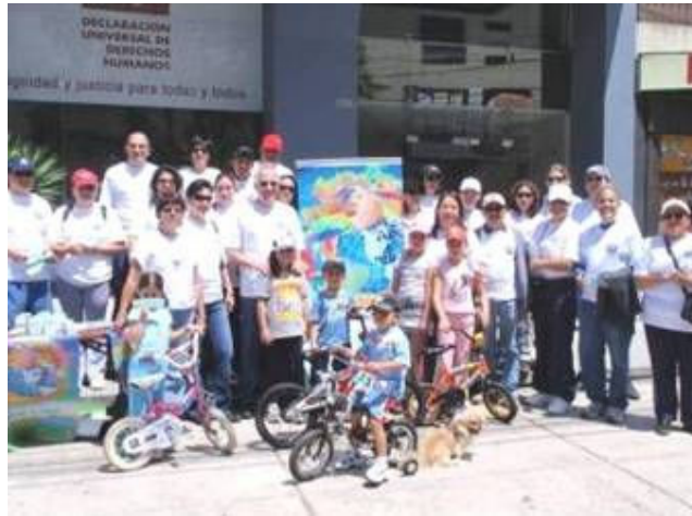
Funcionarios de la OPS/OMS – Ecuador, en el bicipaseo por el Día Mundial de la Salud – 2008

En las afueras del Edificio de Naciones Unidas también se puso una mesa de información y ahí se concentraron los funcionarios de la OPS/OMS, quienes también participaron del bicipaseo u caminaron, celebrando el Día Mundial de la Salud.