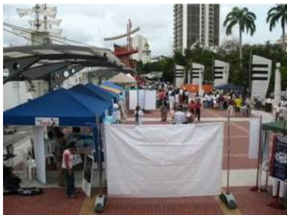
Vista panorámica de la Casa Abierta.

Los asistentes a este evento, además de conocer sobre el cambio climático, tuvieron la oportunidad de recibir información sobre las instituciones y los programas en los que trabajan en beneficio de la salud de los ecuatorianos. La Subsecretaría Regional de Salud Costa-Insular expuso sobre el actual perfil epidemiológico de las enfermedades durante la actual emergencia, además de presentar sobre las acciones relacionadas con la vigilancia de la calidad del agua, así como consejos sobre salud ambiental frente al cambio climático. El SNEM expuso al público las actividades que realizan para el control antivectorial, así como medidas de prevención y control frente al dengue y dengue hemorrágico. SOLCA informó a los asistentes a su Stand sobre cómo prevenir y controlar el cáncer de piel, laringe, así como la alimentación que debemos tener para disminuir el riesgo de otras patologías comunes de gran incidencia en la población.