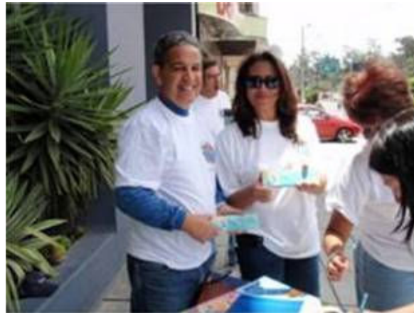
Mesa de información en el Edificio de NN.UU.

En las afueras del Edificio de Naciones Unidas también se puso una mesa de información y ahí se concentraron los funcionarios de la OPS/OMS, quienes también participaron del bicipaseo u caminaron, celebrando el Día Mundial de la Salud.