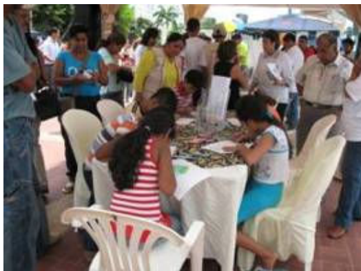
Concurso de dibujo y pintura organizado en la Casa Abierta en Guayaquil.

La celebración tuvo como objetivo sensibilizar e informar a la ciudadanía, fortalecer alianzas entre las diferentes instituciones y diferentes sectores para enfrentar la problemática y llamar la atención de las autoridades sobre la necesidad de proteger la salud de los efectos negativos del cambio climático, una amenaza creciente para la seguridad sanitaria en el planeta.