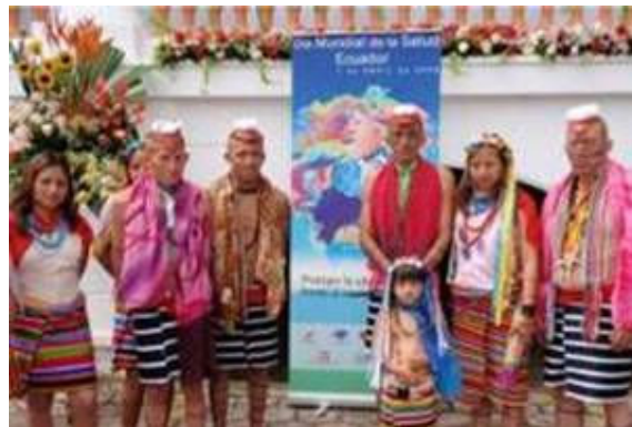
Asistentes a la Sesión Solemne del Día Mundial de la Salud.

Por otra parte, expuso que hoy es un día especial, pero no por tratarse solamente del día Mundial de la Salud, sino porque el gobierno de la revolución ciudadana, inicia y continúa con el proceso de gratuidad progresiva en los servicios de salud a nivel de todo el país.