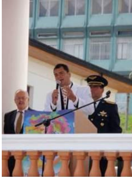
Ec. Rafael Correa, Presidente Constitucional de la República del Ecuador

Dentro de los puntos relevantes en la exposición del Ec. Rafael Correa, Presidente Constitucional de la República del Ecuador, destacó la importancia del lema del Día Mundial de la Salud del 2008, que centra la necesidad de proteger a los habitantes del planeta de los efectos negativos del cambio climático sobre la salud pública y una mayor colaboración mundial para hacer frente a los problemas sanitarios relacionados con el clima que se presenten en todo el mundo.