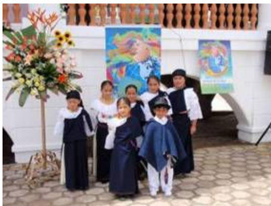
Asistentes a la Sesión Solemne del Día Mundial de la Salud

En el marco del Día Mundial de la Salud, la Sra. Ministra de Salud enfatizó "seguiremos luchando con convicción, compromiso e infinito amor, porque la salud ya es de todos".