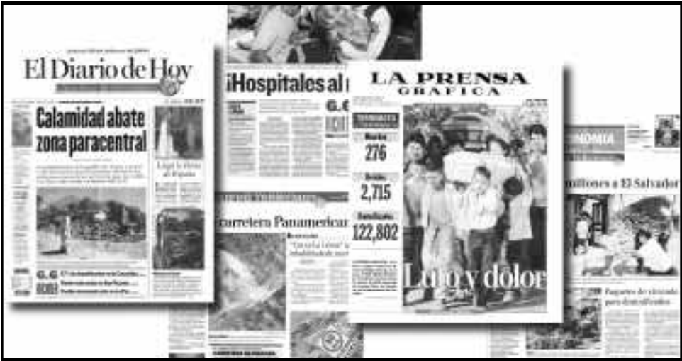
Noticias más importantes publicadas en la prensa de El Salvador.

Estos canales transmitieron información en directo desde los estudios y desde donde se producían los acontecimientos, dando cobertura, vía microonda, telefónica y en diferido, sobre la situación en que estaban las diferentes zonas del país, las distintas necesidades de los refugios, información general sobre el desastre, anuncios oficiales, recomendaciones de seguridad, distribución de la ayuda internacional, información sobre los damnificados a los que aún no había llegado la ayuda, estadísticas, lugares de socorro y teléfono abierto al público para la población que requería información sobre personas con paradero desconocido.