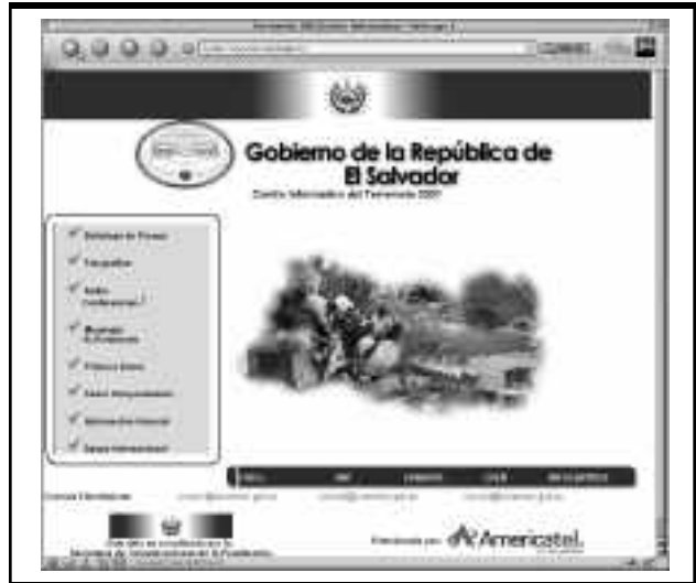
Pantalla principal sobre los terremotos del sitio web del Gobierno de la República de El Salvador ( www.terremoto.gob.sv ).