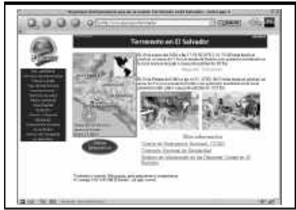
Primera pantalla de la página web de OPS/OMS El Salvador.

En esta página, la OPS realizaba un monitoreo en los