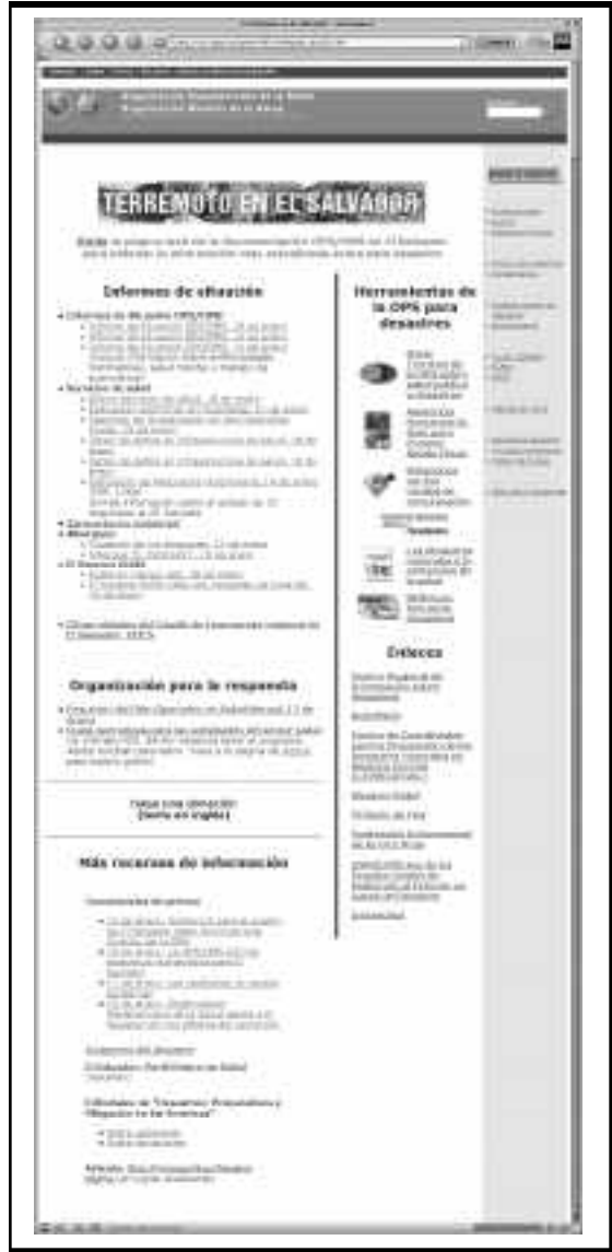
Pantalla de la página web de la OPS/OMS, Washington.

diferentes medios de comunicación y se rescataba información sobre temas y acciones en salud, medio ambiente, obras públicas, situación climatológica, réplicas y otros eventos, con objeto de mantener la información actualizada. El sitio en la web de la Oficina Central en Washington www.paho.org tenía una sección especial sobre el sismo en El Salvador, y proporcionaba acceso a las publicaciones, guías técnicas, directorio y demás instrumentos técnicos que la OPS ha publicado sobre emergencias y desastres.