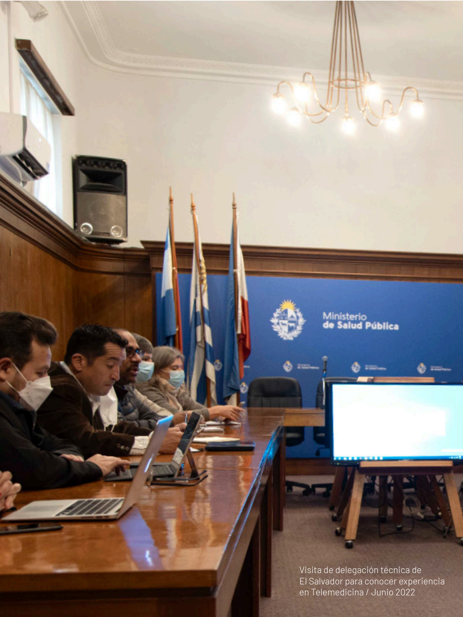
Visita de delegación técnica de El Salvador para conocer experiencia en Telemedicina / Junio 2022