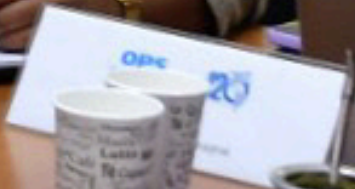
Visita de delegación técnica de Dominica para conocer el proceso de transformación digital de Uruguay Noviembre 2022