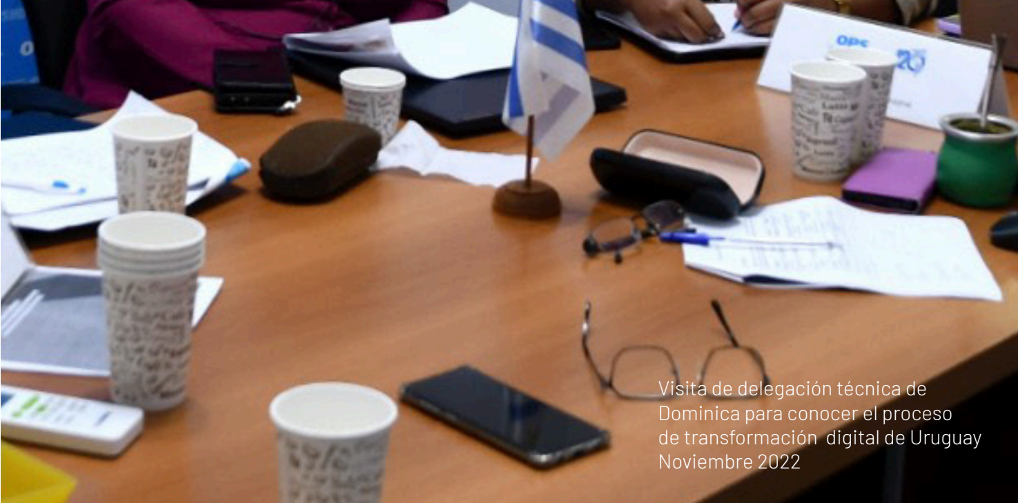
Visita de delegación técnica de Dominica para conocer el proceso de transformación digital de Uruguay Noviembre 2022