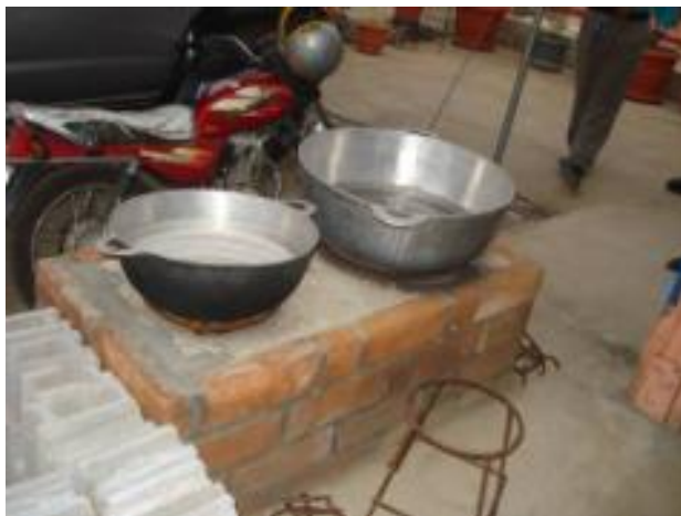
Ecofogón de construcción in situ