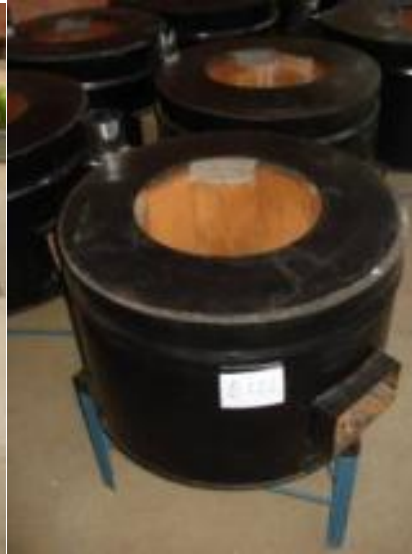
Ecofogón para tortilleras