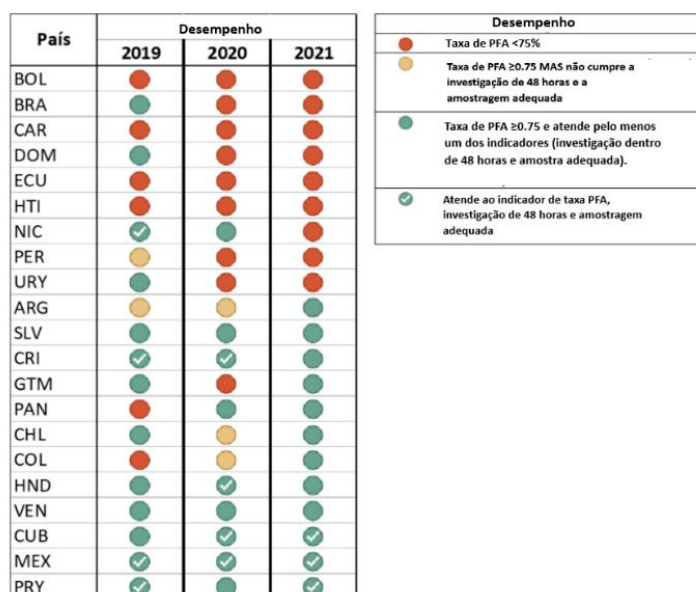
Figura 8. Desempenho geral da vigilância da PFA, Região das Américas, 2019-2021.

Fonte: OPAS/OMS. 14ª Reunião da Comissão Regional para a Certificação (RCC, por sua sigla em inglês) da Erradicação da Poliomielite na Região das Américas. Relatório da Reunião. Disponível em espanhol: https://bit.ly/3loZFdx