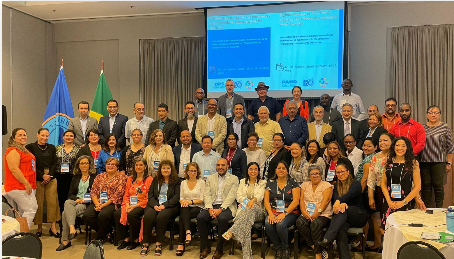
Reunión Regional de jefes de programas y de laboratorio de TB de las Américas