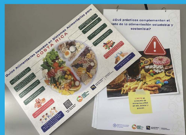
Herramientas educativas elaboradas para uso interinstitucional.