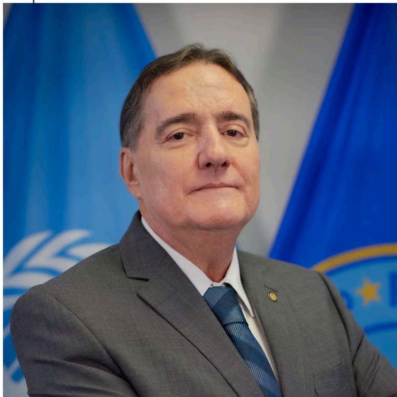
Dr. Jarbas Barbosa, Director Organización Panamericana de la Salud (OPS)

“Garantizar unos servicios de atención primaria de salud para hacer frente a las ENT que sean de alta calidad, seguros, completos, integrados, accesibles, disponibles y asequibles para todos debe ser nuestro principio rector.