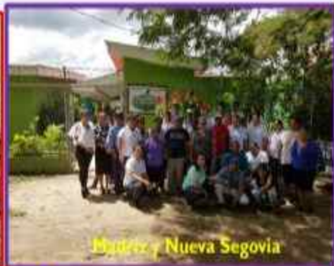
Matanzas y Nueva Segovia