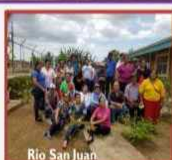
Río San Juan