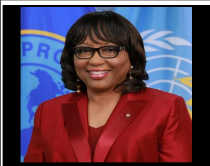
Carissa F. Etienne Directora de la OPS