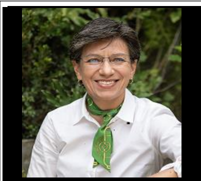
Claudia López Hernández Alcaldesa de Bogotá Colombia