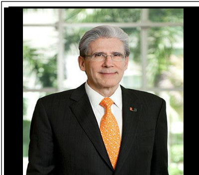
Julio Frenk Rector de la Universidad de Miami, EE.UU.